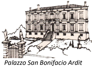
Palazzo San Bonifacio Ardit